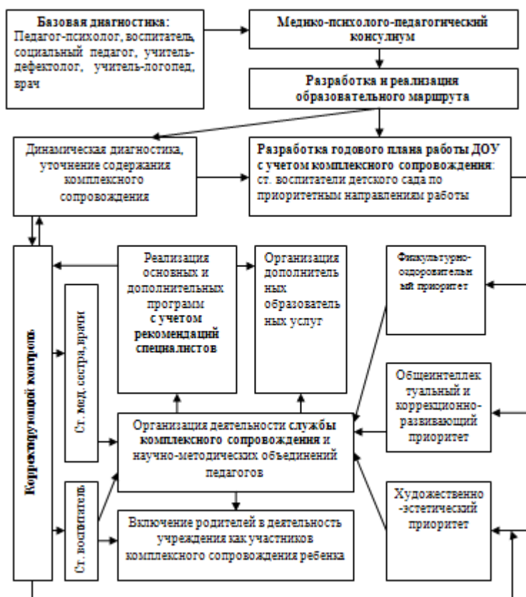
Схема взаимодействия специалистов

Работой по образовательной области « Речевое развитие » руководит учитель-логопед, а другие специалисты подключаются к работе и планируют образовательную деятельность в соответствии с рекомендациями учителя-логопеда.